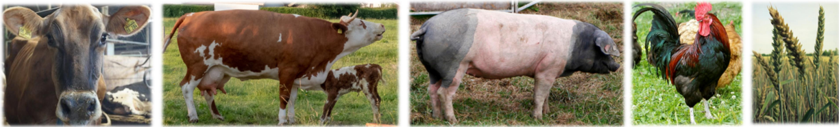
z.B. Milchvieh, Fleischrind, Schwein, Geflügel, Getreide (Kombination möglich)